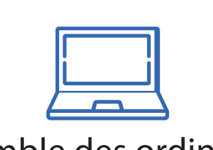
Ensemble des ordinateurs du cabinet

Attention, si la période d'arrêt prolongé est supérieure à 5 semaines sans acquisition, une procédure de redémarrage est indispensable, appelez votre technicien référent. Si vous avez respecté les recommandations de maintenance hebdomadaire durant la période, ne pas tenir compte de la remarque ci-dessus : - Faire une séquence de 2 expositions à vide, dans l'ordre indiqué ci-dessous : 1 panoramique enfant puis 1 panoramique adulte