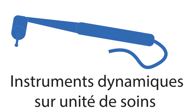
Instruments dynamiques sur unité de soins

Ouvrir toutes les vannes d'eau et d'air fermées