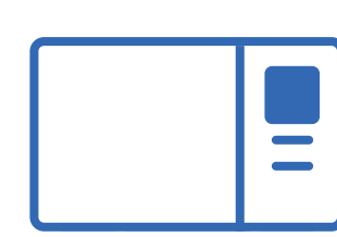
Autoclaves raccordés sur le réseau d'eau

Attention, si la période d'arrêt prolongé est supérieure à 3 semaines sans acquisition, une procédure de redémarrage est indispensable, appelez votre technicien référent. Si vous avez respecté les recommandations de maintenance hebdomadaire durant la période, ne pas tenir compte de la remarque ci-dessus : - Faire une séquence de 3 expositions à vide (sans patient, sans capteur) dans l'ordre ci-dessous : 1 exposition incisive enfant puis 1 exposition incisive adulte et enfin 1 exposition molaire adulte