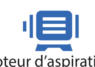
Moteur d'aspiration chirurgical