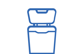
Appareil de désinfection des rotatifs