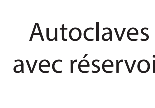
Autoclaves avec réservoir