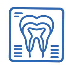
Appareil de radio intra-oral

Faire une séquence de 3 expositions à vide (sans patient, sans capteur) dans l'ordre indiqué ci-dessous : 1 exposition incisive enfant puis 1 exposition incisive adulte et enfin 1 exposition molaire adulte.